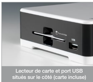
Lecteur de carte et port USB situés sur le côté (carte incluse)

Utilisation d'un décodeur et d'une carte TNTSAT exclusivement limitée au Territoire Français Métropolitain et Monaco, au profit de personnes physiques, pour un usage privé et personnel.