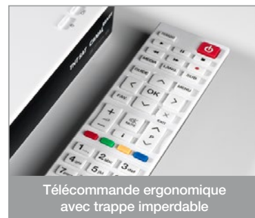
Télécommande ergonomique avec trappe imperdable