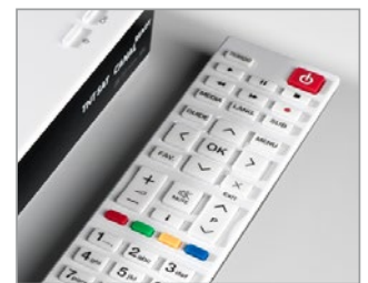
Télécommande ergonomique avec trappe imperdable