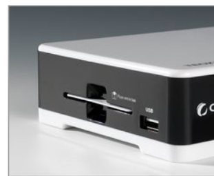
Lecteur de carte et port USB situés sur le côté (carte incluse)

La durée de validité de la carte TNTSAT est de 4 ans. Voir conditions de renouvellement au terme de ces 4 ans sur le site www.tntsatsat.tv . Utilisation d'un décodeur et d'une carte TNTSAT exclusivement limitée au Territoire Français Métropolitain et Monaco, au profit de personnes physiques, pour un usage privé et personnel.